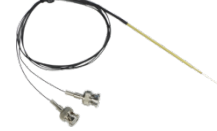
开尔文探针夹具 (4 线测试)