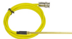
三同轴 Triaxial 探针夹具